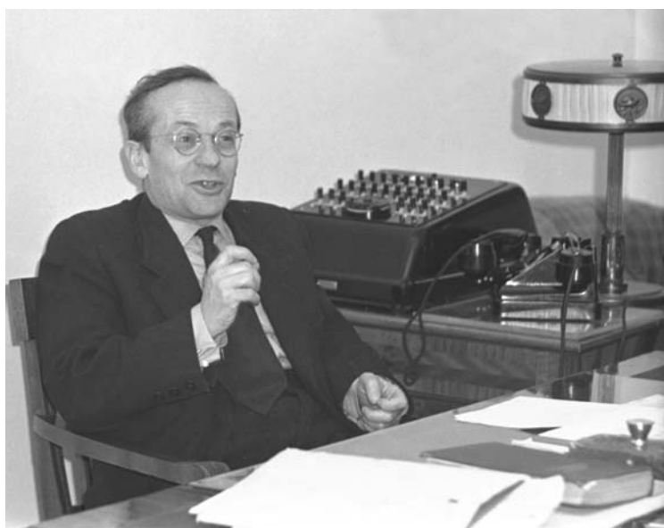
Не только серьезно...