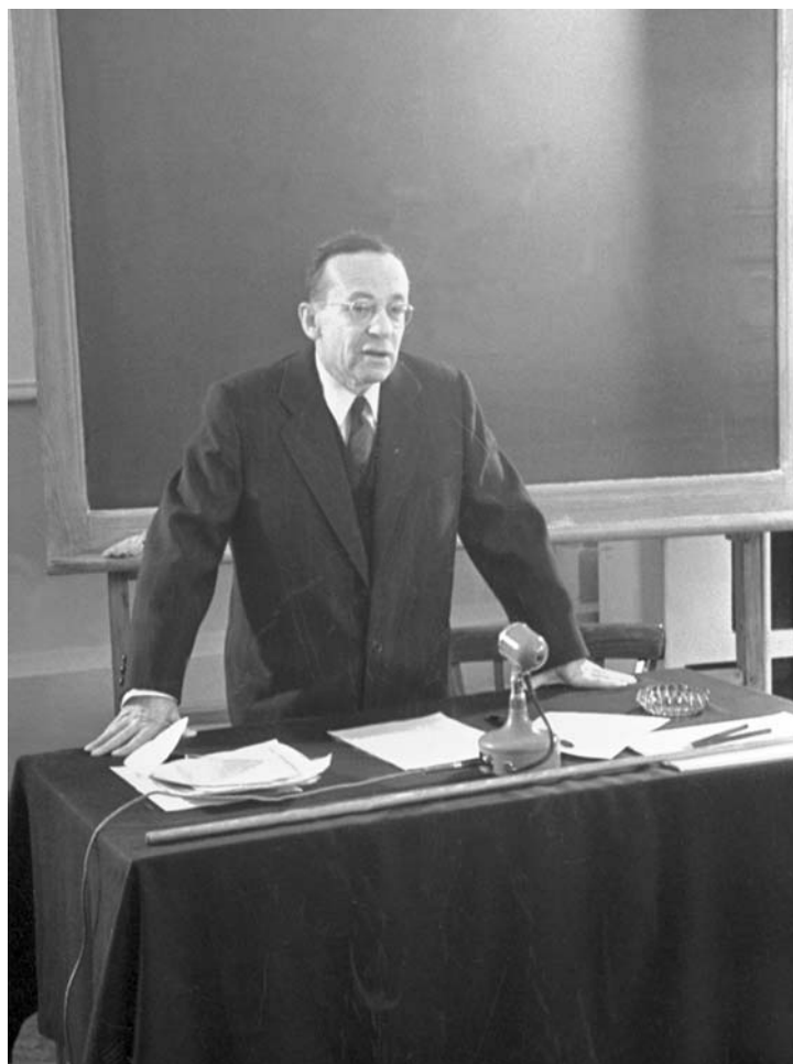
В. И. Векслер выступает на Ученом совете ОИЯИ