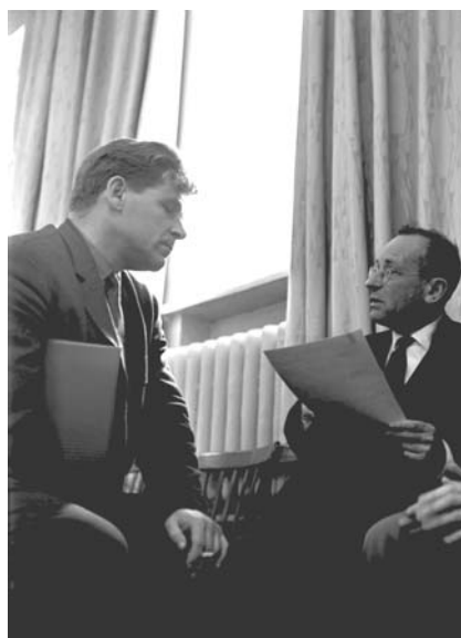
И. В. Чувило и В. И. Векслер. 1964 г.