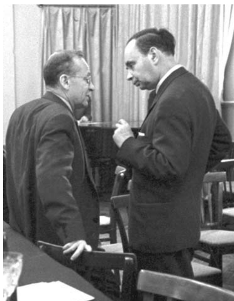
В. И. Векслер и И. М. Франк на сессии Ученого совета ОИЯИ. 1964 г.