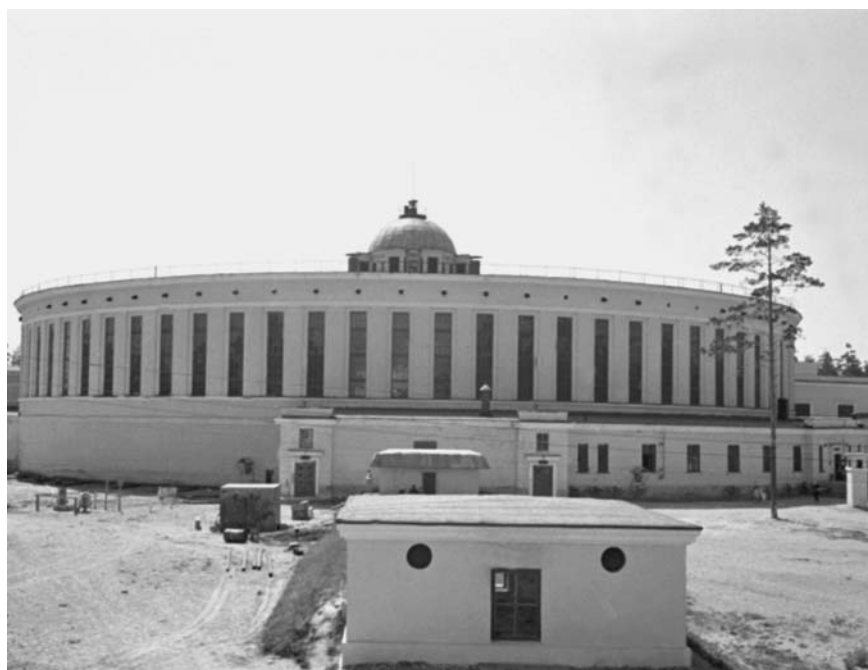
Главное здание синхрофазотрона