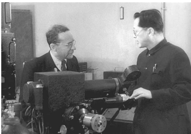
В. И. Векслер и вице-директор ОИЯИ Ван Ганчан (КНР). 1960 г.