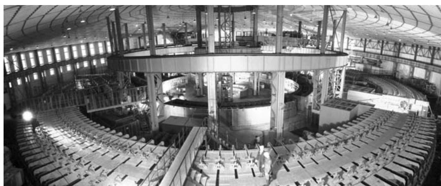
Синхрофазотрон. Общий вид