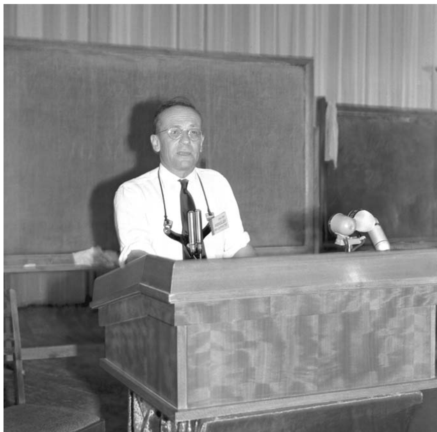
В. И. Векслер на Международной конференции по физике высоких энергий. Киев, 1959 г.