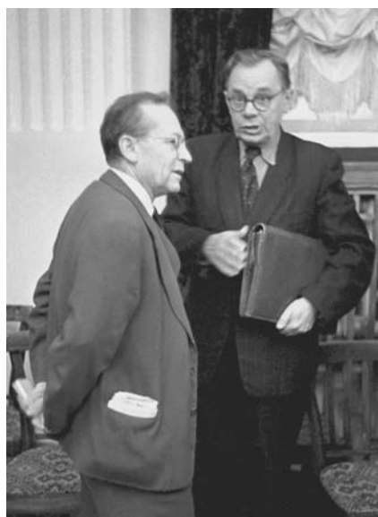
В. И. Векслер и Н. И. Павлов. 1964 г.