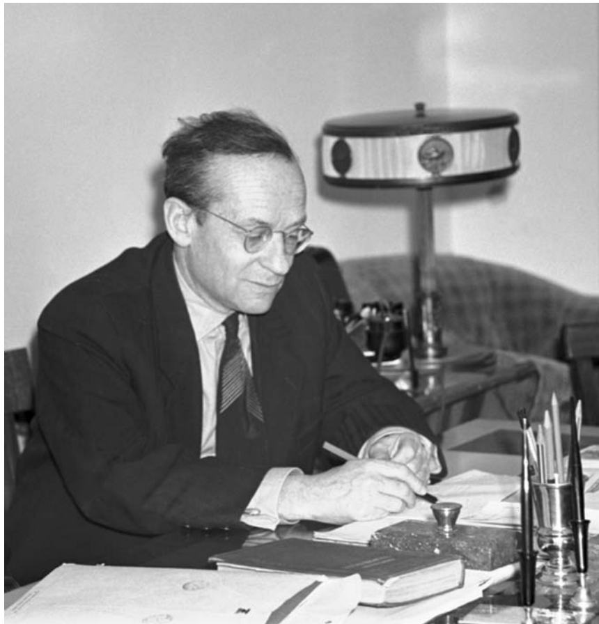
В. И. Векслер в своем рабочем кабинете в Лаборатории высоких энергий. Начало 60-х годов