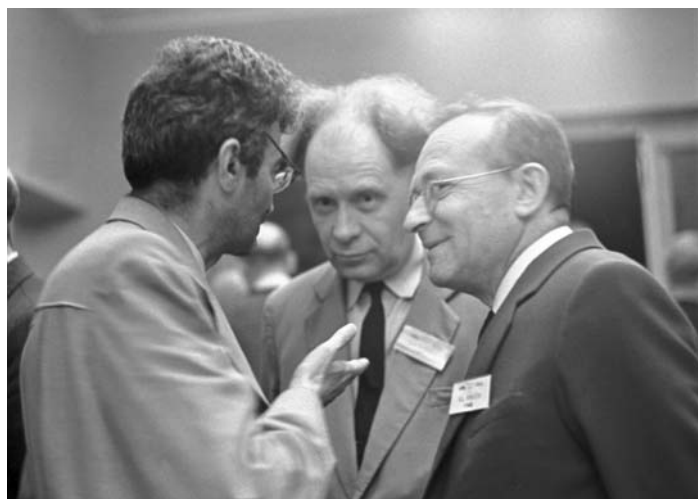
И. Я. Померанчук, С. Н. Вернов, В. И. Векслер. 1964 г.