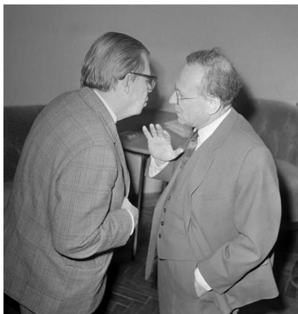
Н. Н. Боголюбов и В. И. Векслер. 1965 г.