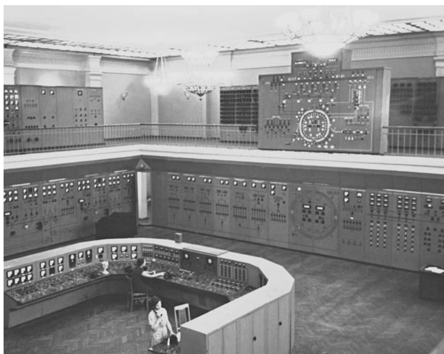
Пульт управления синхрофазотроном