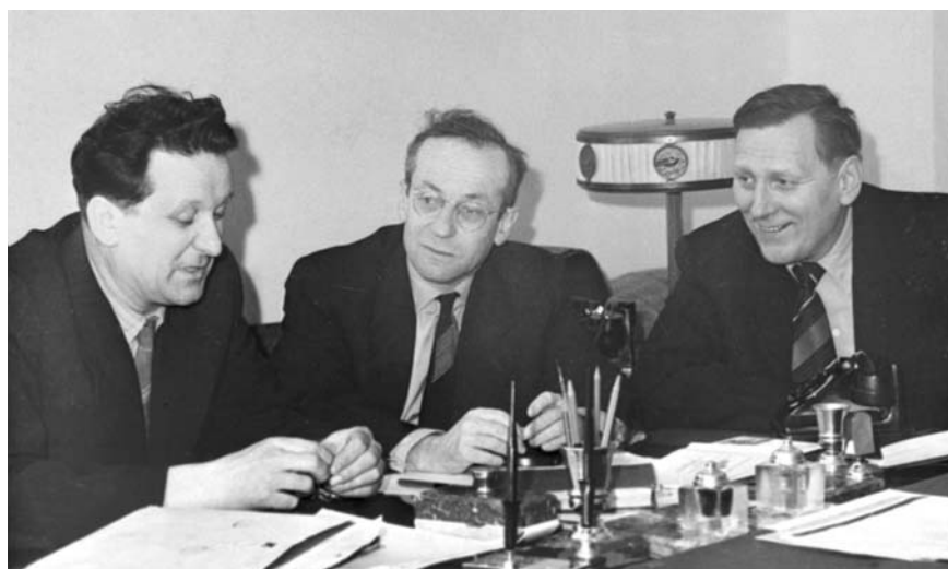
Л. П. Зиновьев, В. И. Векслер, В. А. Петухов. 1960 г.