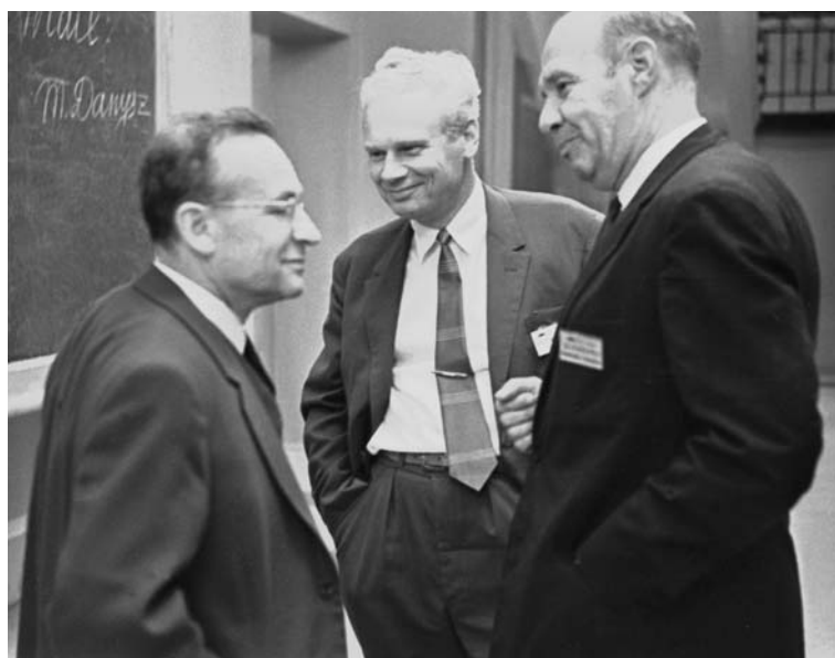
В. И. Векслер, В. В. Владимирский, Д. И. Блохинцев. 1965 г.