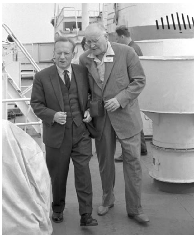
В. И. Векслер и А. Л. Минц на теплоходе. 1964 г.