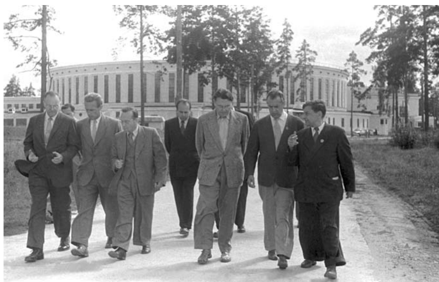
Американские ученые и сенаторы в ОИЯИ. Лаборатория высоких энергий, 1957 г.