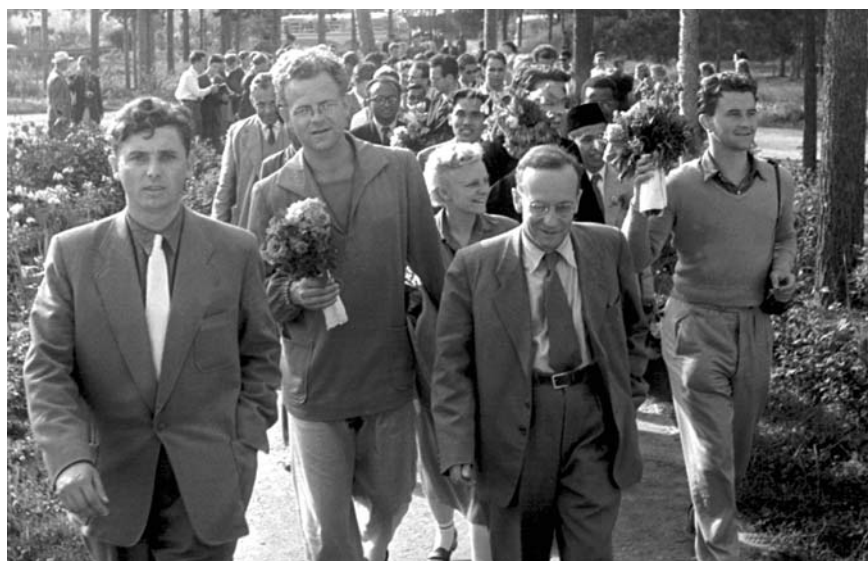
В. И. Векслер среди участников VI Всемирного фестиваля молодежи, посетивших Дубну. 1956 г.