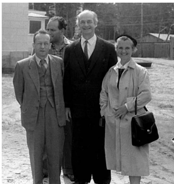
В. И. Векслер с лауреатом Нобелевской премии Л. Полингом и его супругой перед зданием синхрофазотрона. 1959 г.