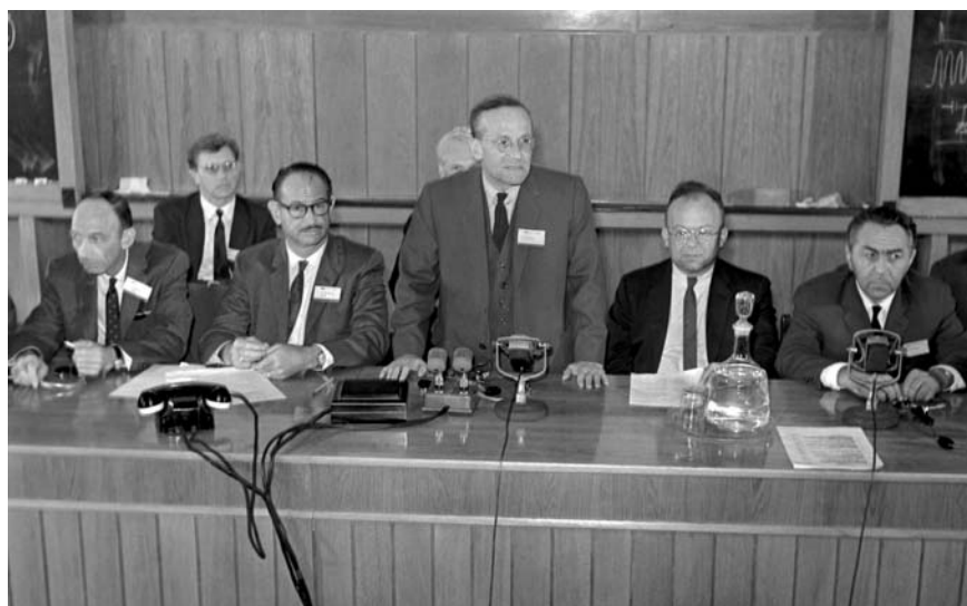
Президиум Международной конференции по ускорителям. Слева направо: Дж. К. Грин (США), Э. Макмиллан (США), В. И. Векслер, В. Панофский (США), В. П. Джелепов. 1963 г.