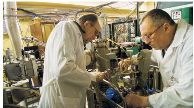
Лаборатория ядерных реакций им. Г. Н. Флерова. Эксперимент по синтезу элемента 117