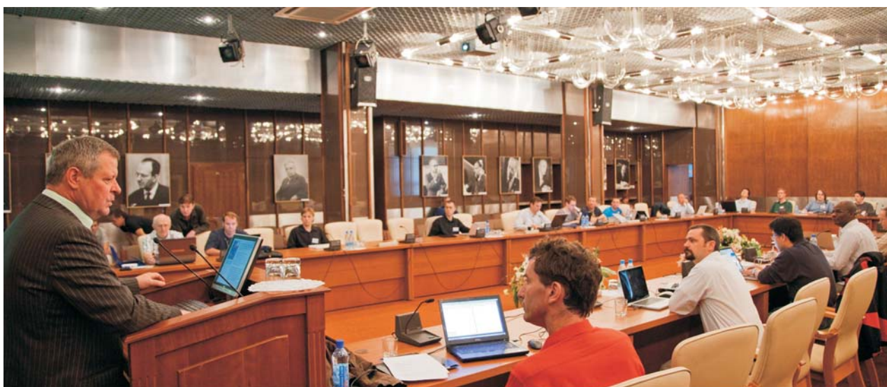
Дубна, 11–13 мая. Сопровождение рабочей группы коллаборации ATLAS по физике на LHC (ЦЕРН)