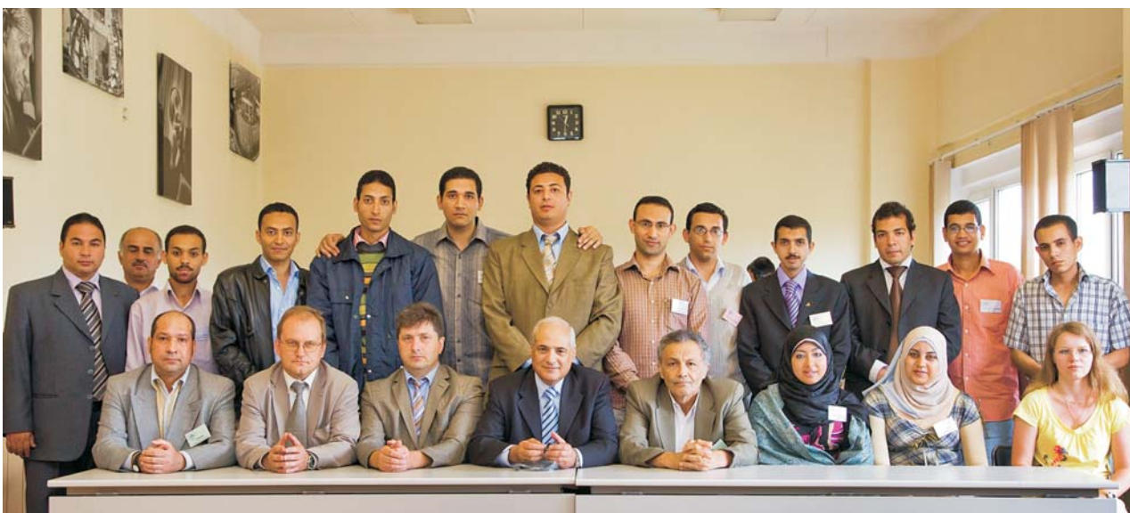
Учебно-научный центр, май–июнь. Участники практики по направлениям исследований ОИЯИ — студенты из Арабской Республики Египет и ее организаторы