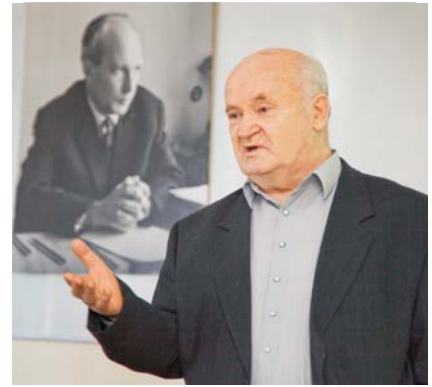
Лаборатория нейтронной физики им. И. М. Франка, 6 апреля. Общелабораторный семинар, посвященный 95-летию со дня рождения Ф. Л. Шапиро (1915–1973)