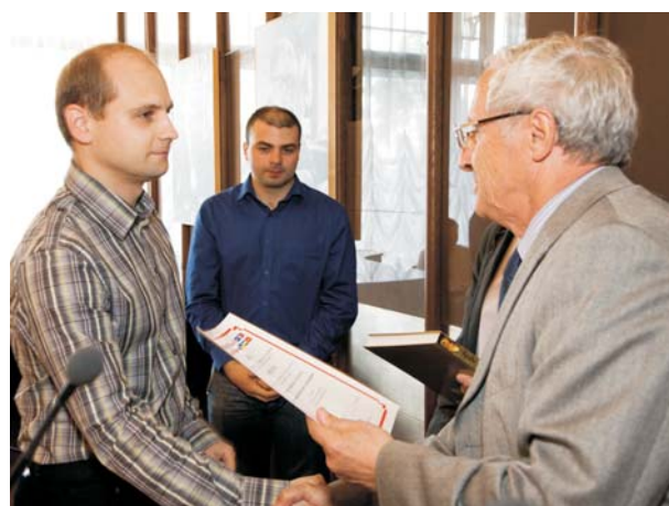
Дубна, 7 июня. Вручение дипломов молодым ученым и специалистам — победителям конкурса научных работ