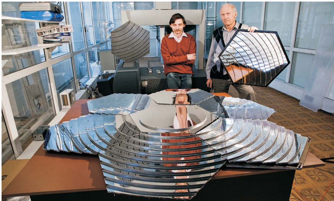
Лаборатория ядерных проблем им. В. П. Дзелепова. Технологический образец фокусирующего зеркала для работы в открытом космосе, созданный в ОИЯИ в рамках космического эксперимента ТУС