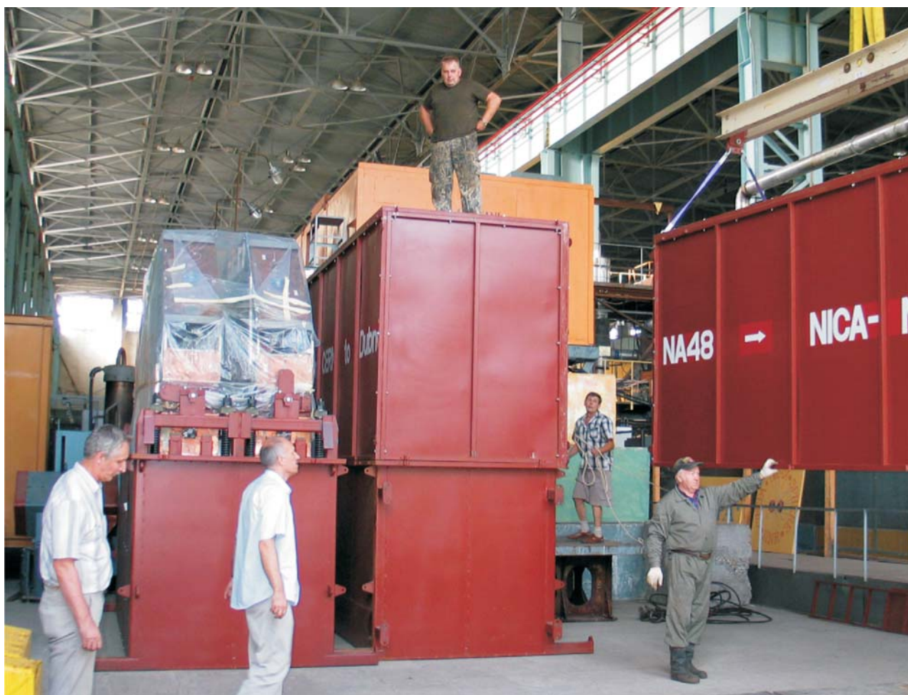
Дубна, июль. Разгрузка камер NA48 в экспериментальной зоне ЛФВЭ