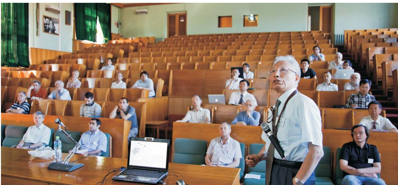
Лаборатория теоретической физики им. Н. Н. Боголюбова, 28 июня. Двустороннее совещание ОИЯИ–КНР по ядерной физике