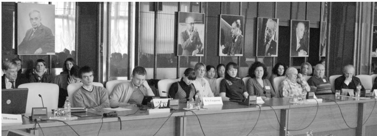
Дубна, 29 марта. Рабочее совещание «Использование ускорителей заряженных частиц для изучения радиационных повреждений в системах высокого уровня организации (космические, медико-биологические и технические аспекты)»