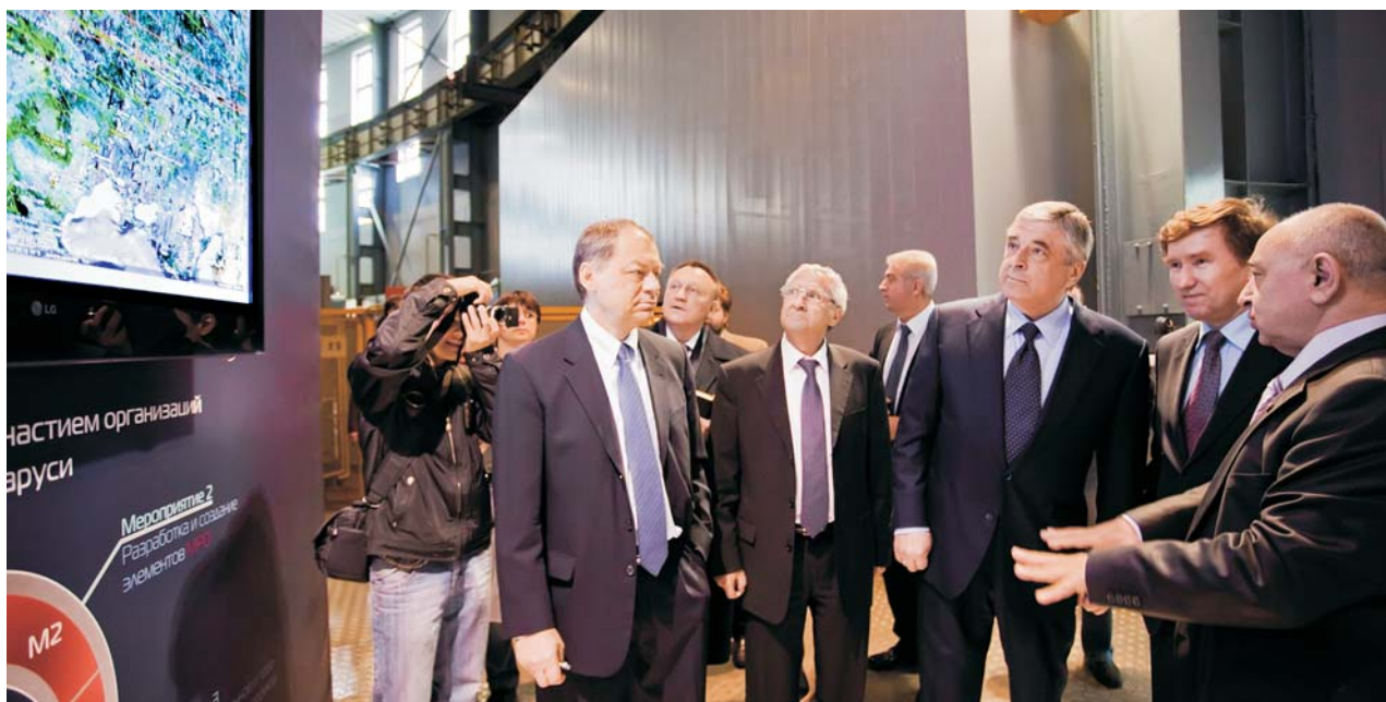
Лаборатория физики высоких энергий им. В. И. Векслера и А. М. Балдина, 13 апреля. Визит в ОИЯИ Государственного секретаря Союзного государства Белоруссии и России П. П. Бородина (в центре)