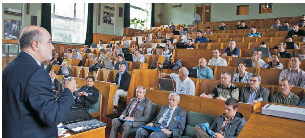
Дубна, 23 августа. Международное рабочее совещание «Критическая точка и начало деконфайнмента»