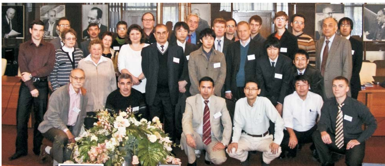
Дубна, 27 сентября. Участники 4-го Международного совещания «Молекулярно-динамические исследования в науках о веществе и биологии» (MSSMBS-2010)