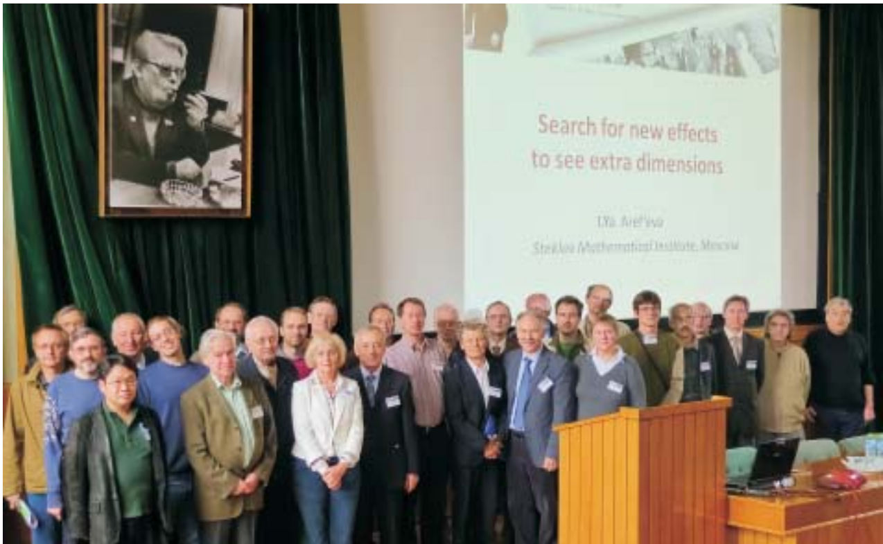
Дубна, 22 сентября. Участники Боголюбовских чтений