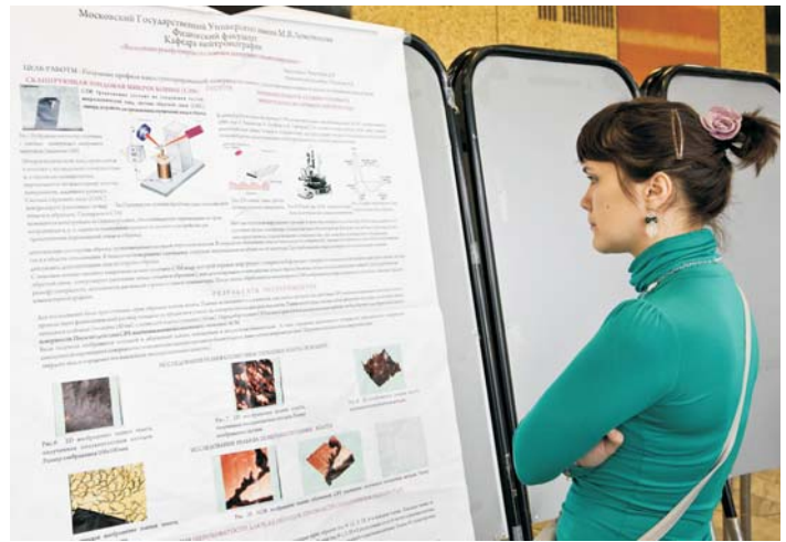
Дубна, 25 октября – 2 ноября. Научная школа ЛНФ «Современная нейтронография: фундаментальные и прикладные исследования функциональных и наноструктурированных материалов»