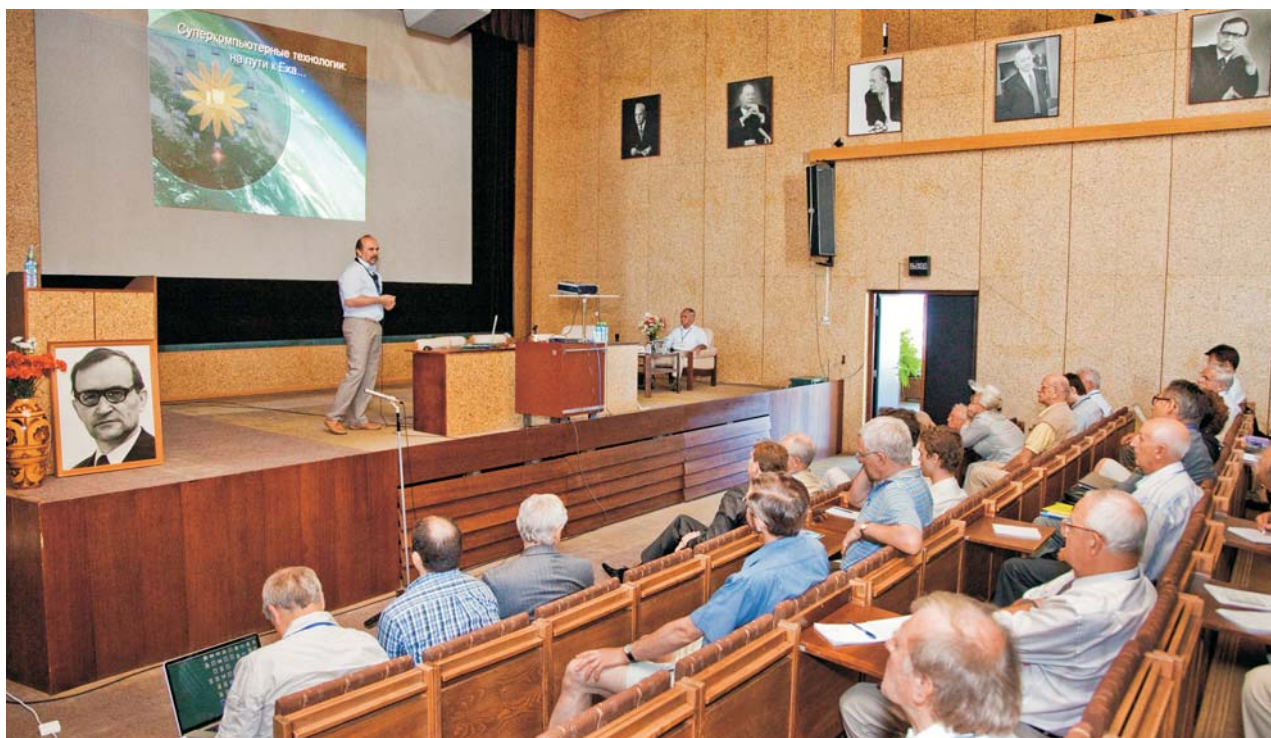
Дубна, 28 июня – 3 июля. 4-я Международная конференция «Распределенные вычисления и грид-технологии в науке и образовании»