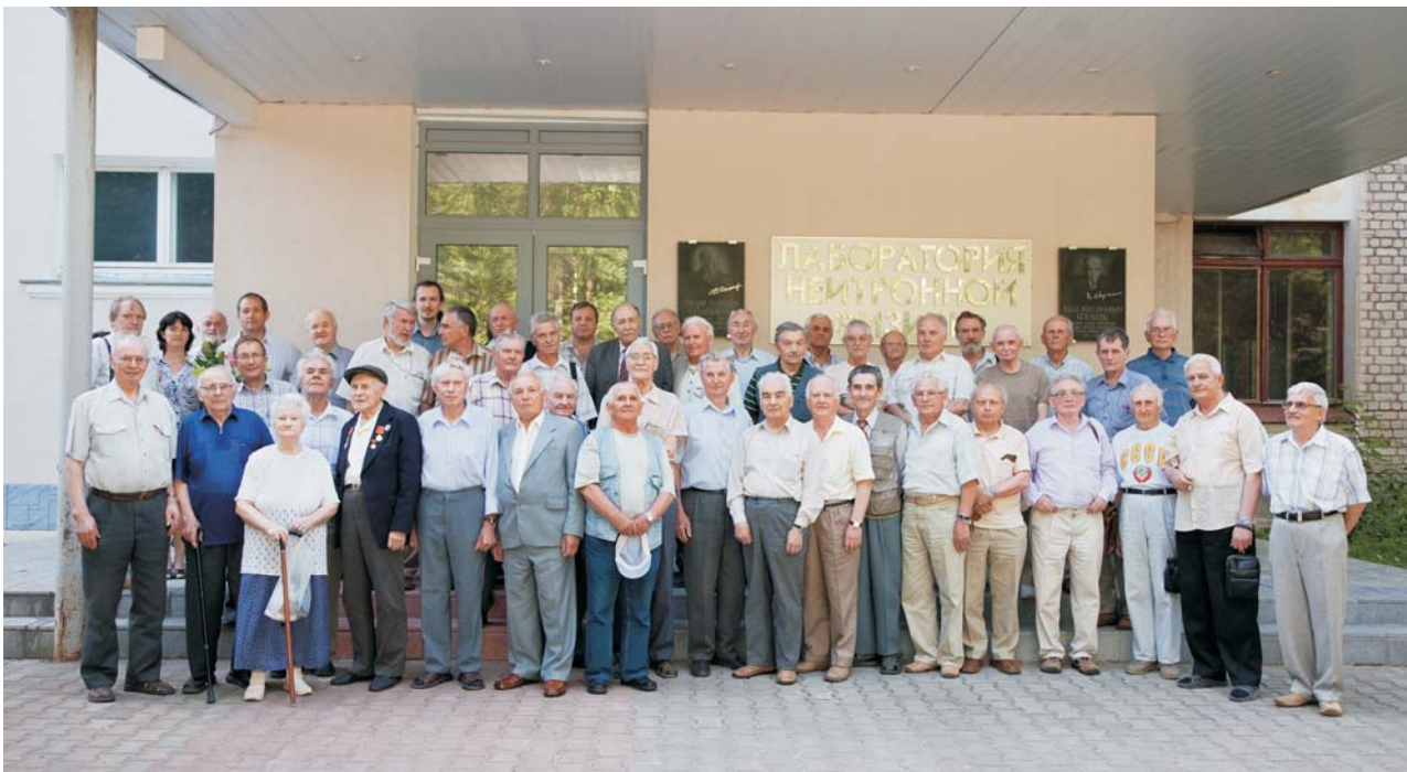
Дубна, 23 июня. Ветераны Лаборатории нейтронной физики им. И. М. Франка и гости — участники общелабораторного семинара «50 лет истории импульсных исследовательских реакторов в Дубне»