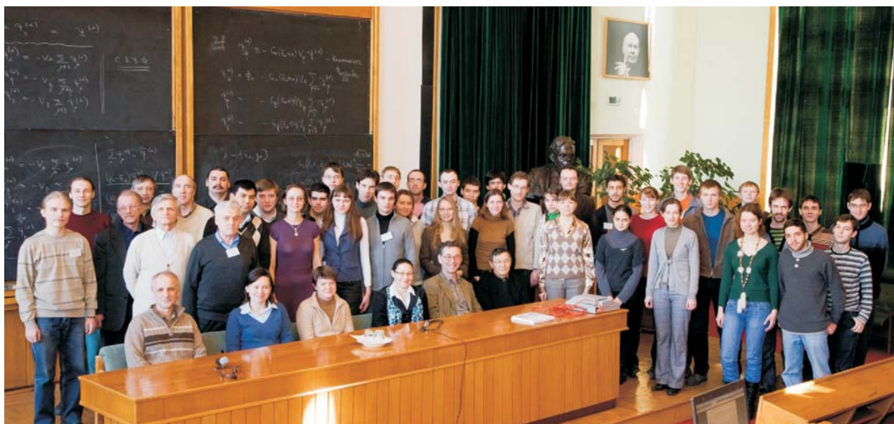
Дубна, февраль. Участники 8-й Зимней школы по теоретической физике