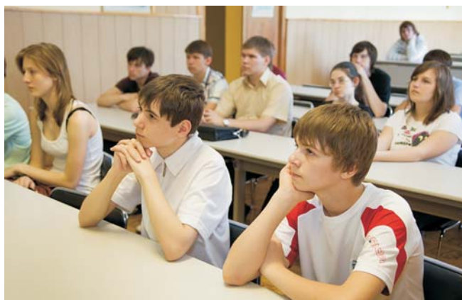
Учебно-научный центр, 13 мая. Видеоконференция для школьников «Исследование космических лучей широких атмосферных ливней с использованием распределенного детектора РУСАЛКА»