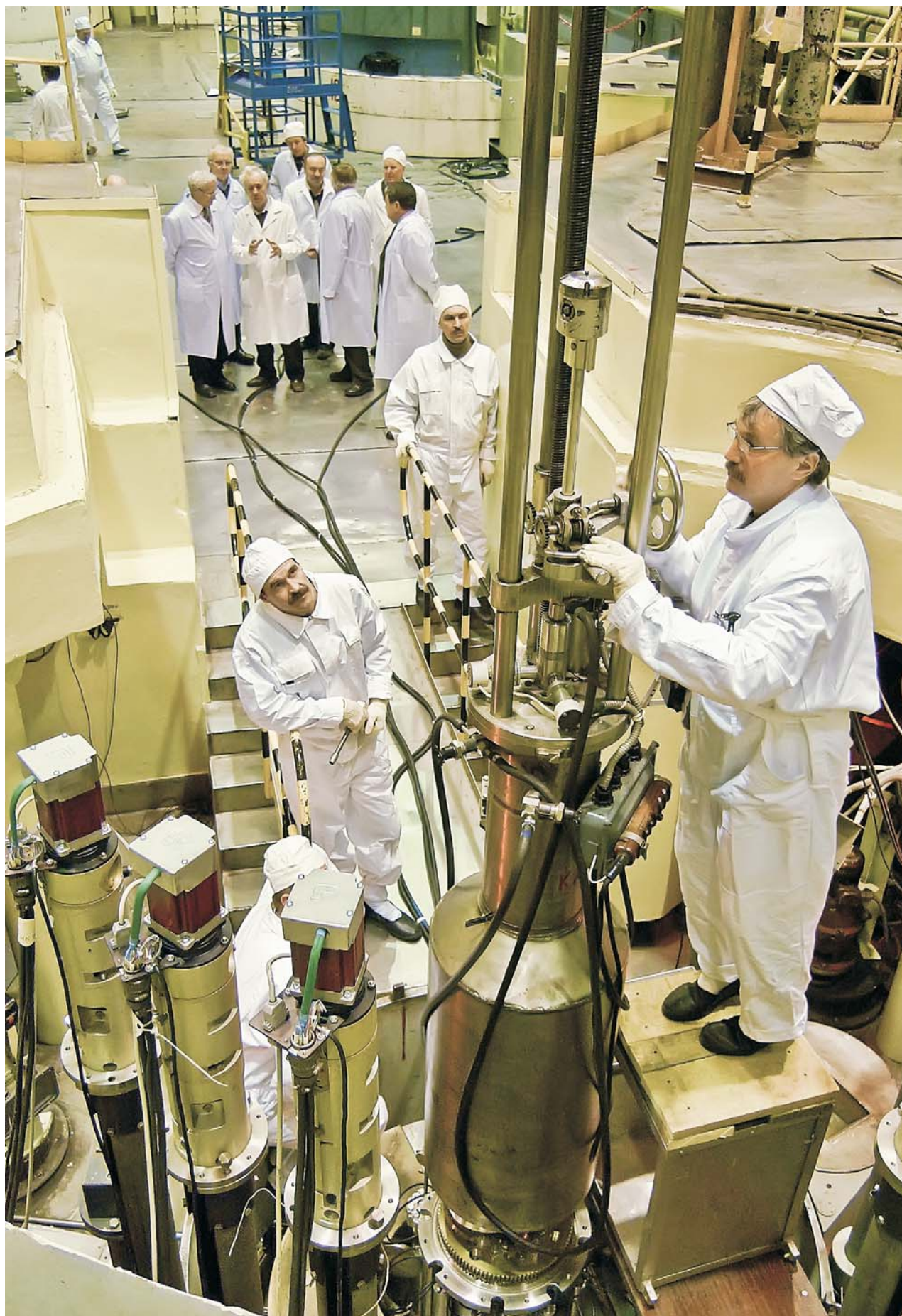
Лаборатория нейтронной физики им. И. М. Франка, 17 декабря. Загрузка ядерного топлива в активную зону реактора ИБР-2