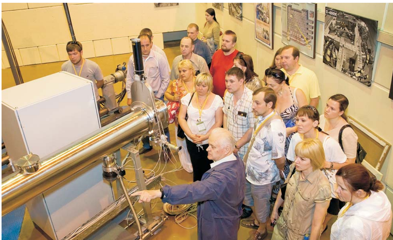
Дубна, 22 июня. Учителя российских школ на экскурсии в Лаборатории ядерных реакций им. Г. Н. Флерова