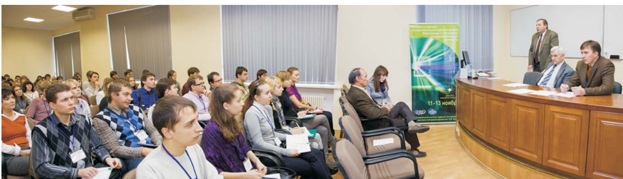
Лаборатория нейтронной физики им. И. М. Франка, 11–13 ноября. Научная школа «Приборы и методы экспериментальной ядерной физики. Электроника и автоматика экспериментальных установок»