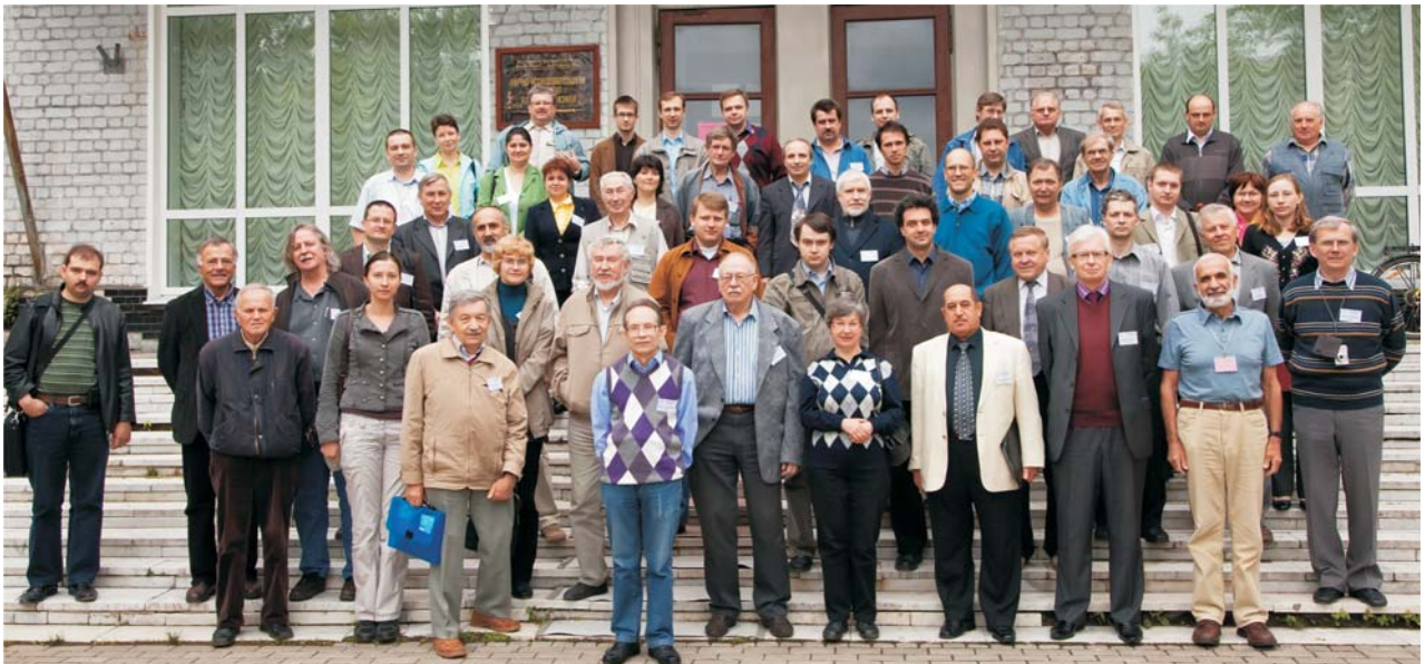
Дубна, 26 мая. Участники 18-го Международного семинара по взаимодействию нейтронов с ядрами (ISINN-18)