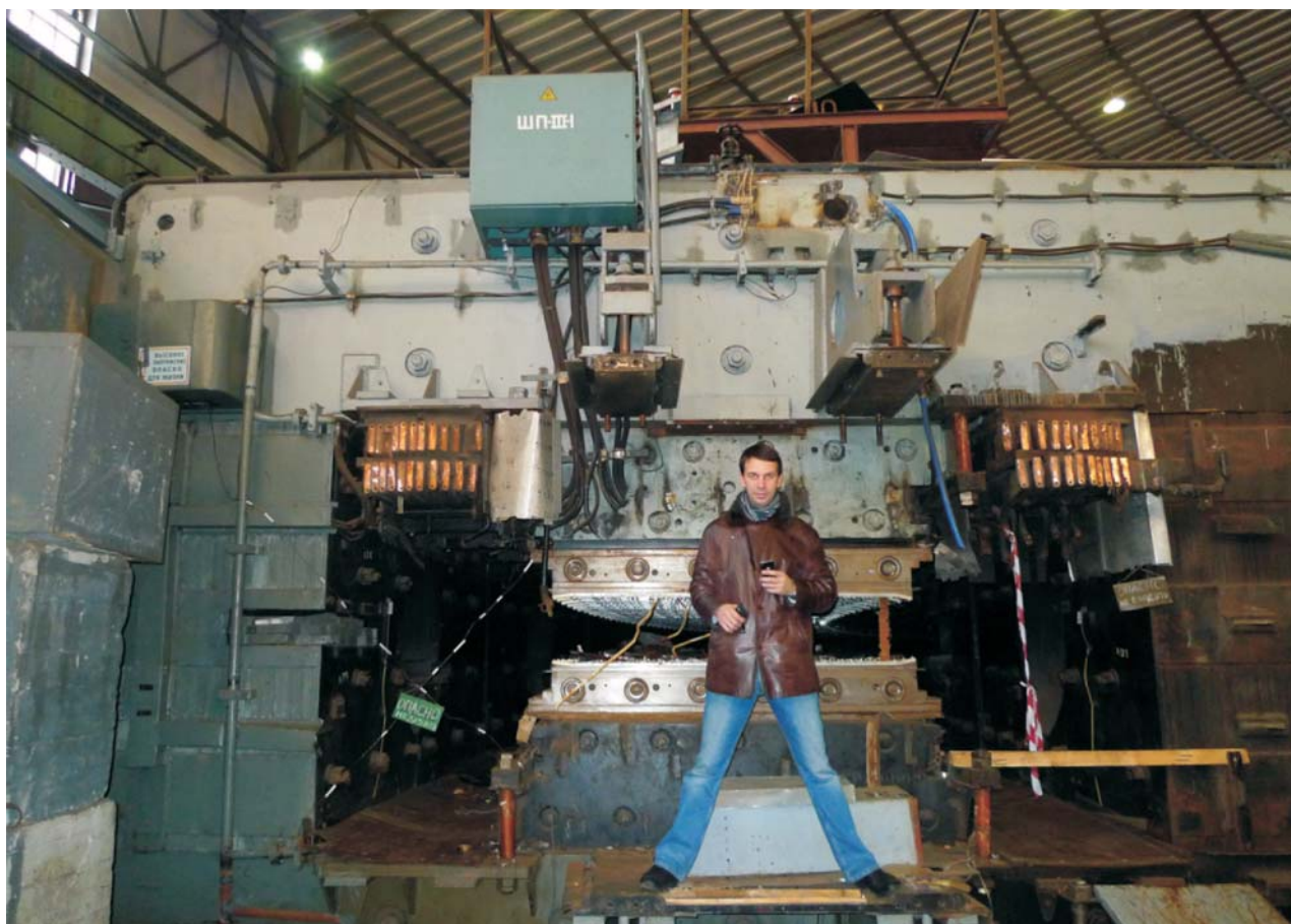
Лаборатория физики высоких энергий им. В. И. Векслера и А. М. Балдина. Демонтаж обмоток магнита синхрофазотрона