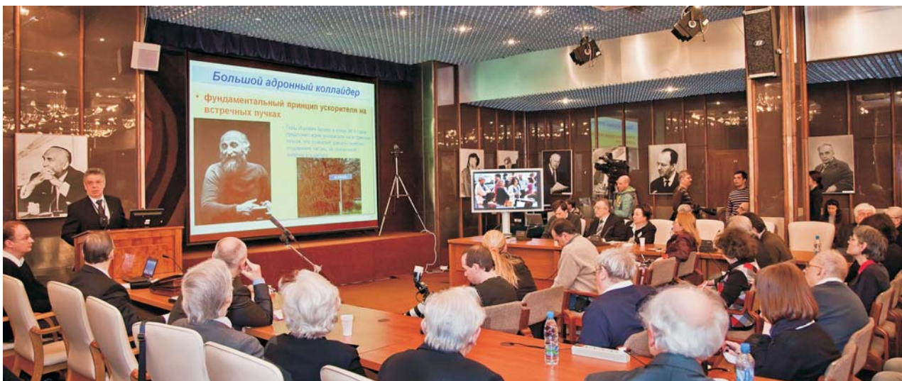
Дубна, 30 марта. Научный семинар «Физика на большом адронном коллайдере (LHC) ЦЕРН», посвященный медиапрезентации первых столкновений пучков LHC при энергии 7 ТэВ