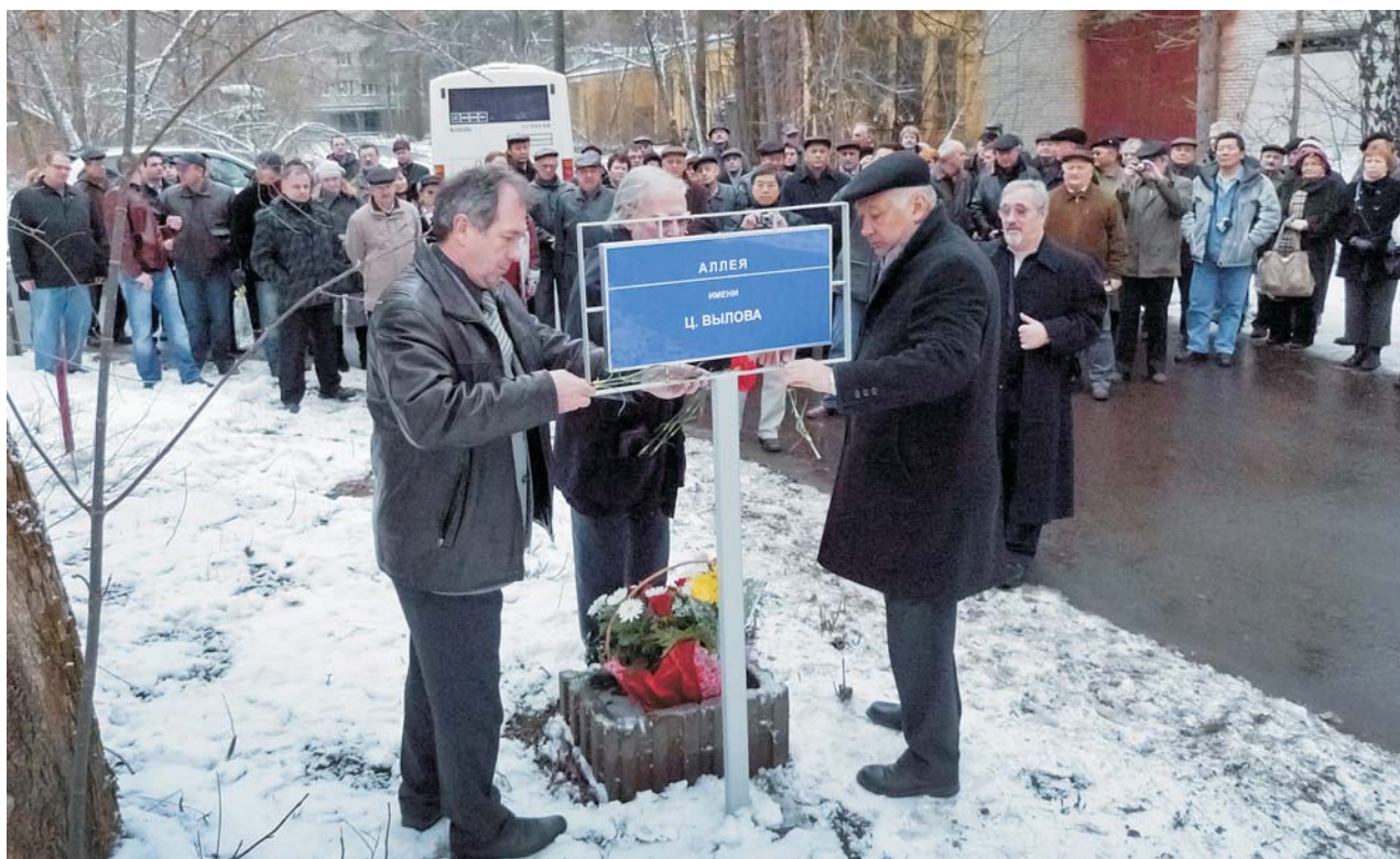
Лаборатория ядерных проблем им. В. П. Дзелепова, 27 ноября. Открытие аллеи им. Цветана Вылова