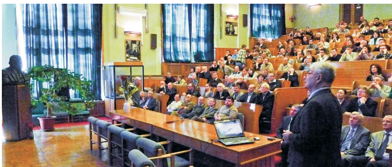
Лаборатория теоретической физики им. Н. Н. Боголюбова, 14 апреля. Общественный семинар «Синтез нового 117-го элемента»