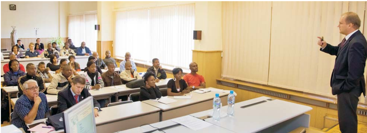
Учебно-научный центр, 7 сентября. Открытие практики по направлениям исследований ОИЯИ для студентов из ЮАР