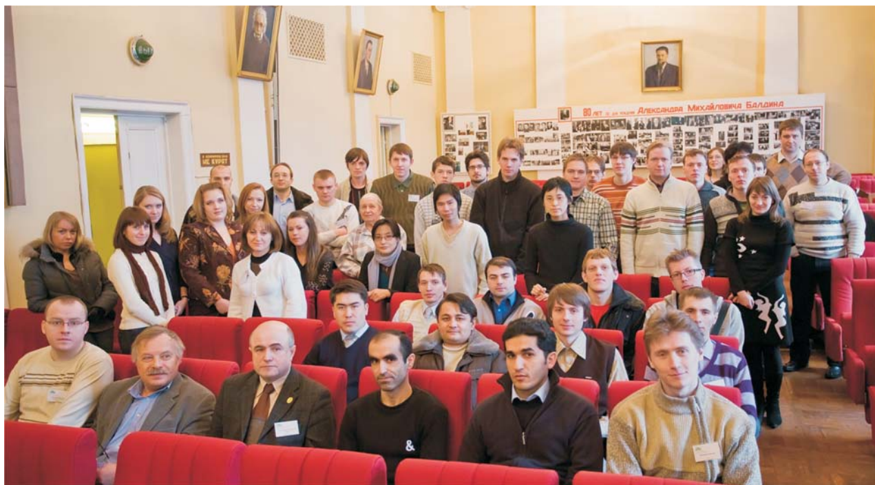
Дубна, февраль. Участники 14-й научной конференции молодых ученых и специалистов ОИЯИ «ОМУС-2010»