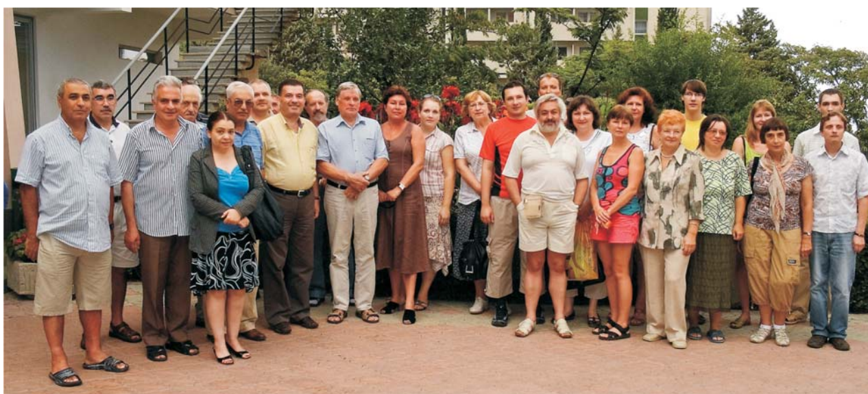
Алушта (Украина), 5 сентября. Участники IV Сисакьяновских чтений «Проблемы биохимии, радиационной и космической биологии»