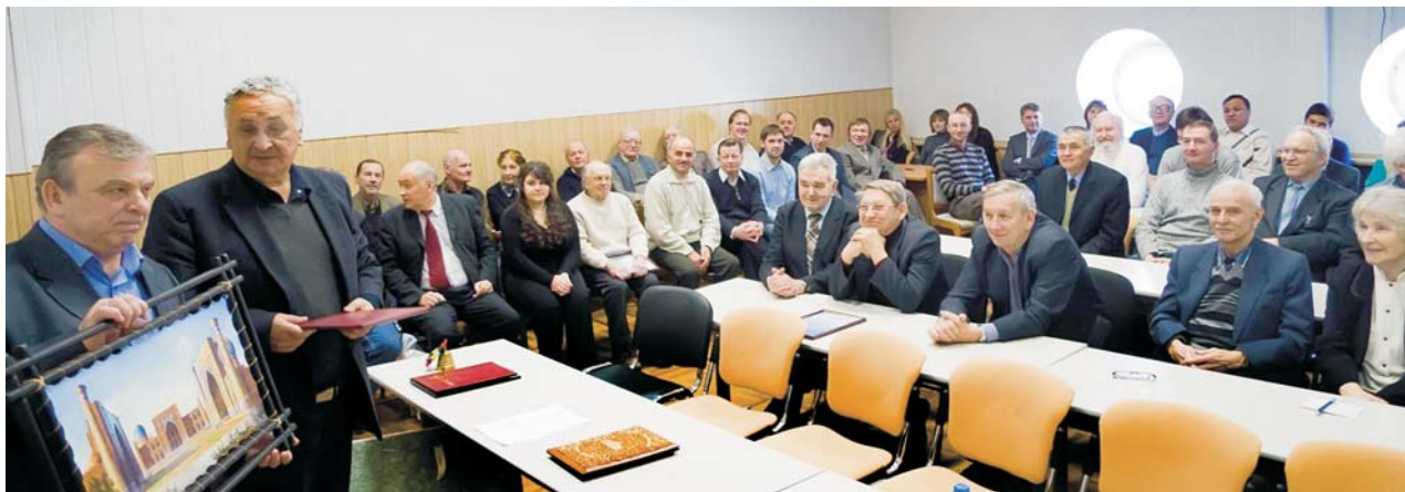
Лаборатория ядерных проблем им. В. П. Джелепова. Юбилейный семинар, посвященный 50-летию научно-экспериментального отдела ядерной спектроскопии и радиохимии ЛЯП