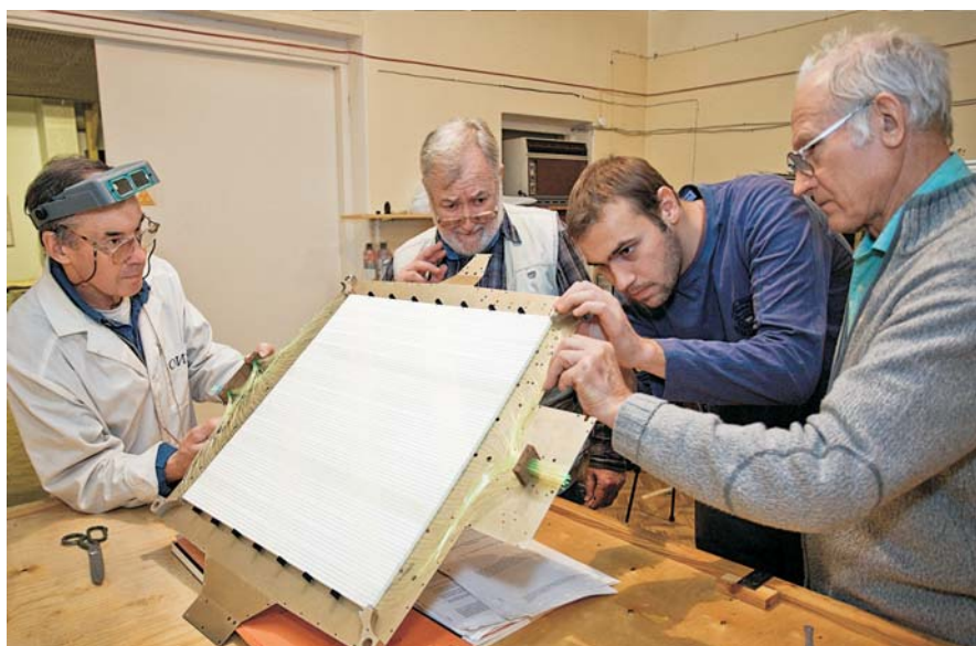
Лаборатория ядерных проблем им. В. П. Джелепова. Сборка триггерного модуля полетного образца детектора НУКЛОН