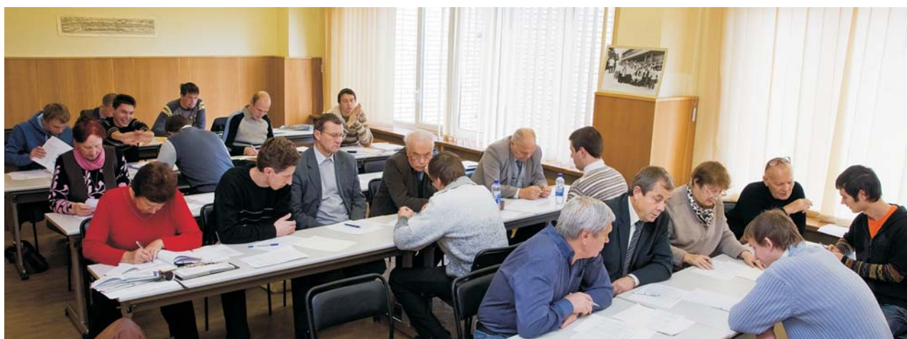
Дубна, 15 октября. Государственный экзамен для студентов 6-го курса базовой кафедры ОИЯИ «Электроника физических установок» МИРЭА