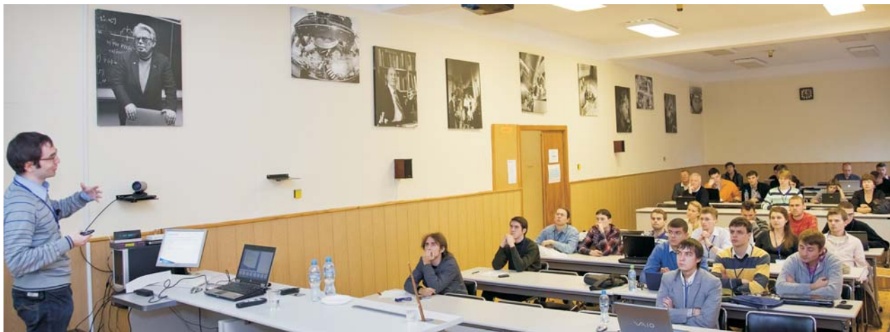
Учебно-научный центр, 26 октября. Школа ОИЯИ-ЦЕРН по информационным и грид-технологиям