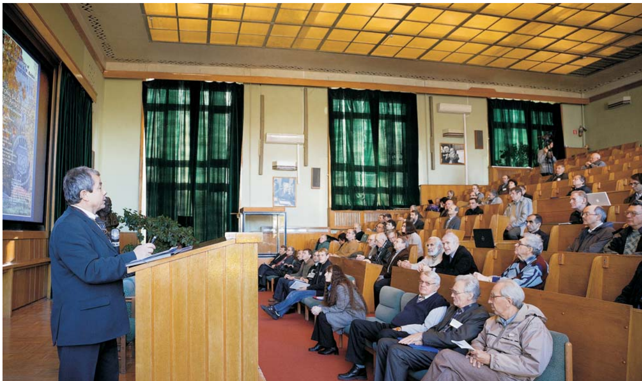
Дубна, 4 октября. 20-й Балдинский международный семинар по проблемам физики высоких энергий «Релятивистская ядерная физика и квантовая хромодинамика»